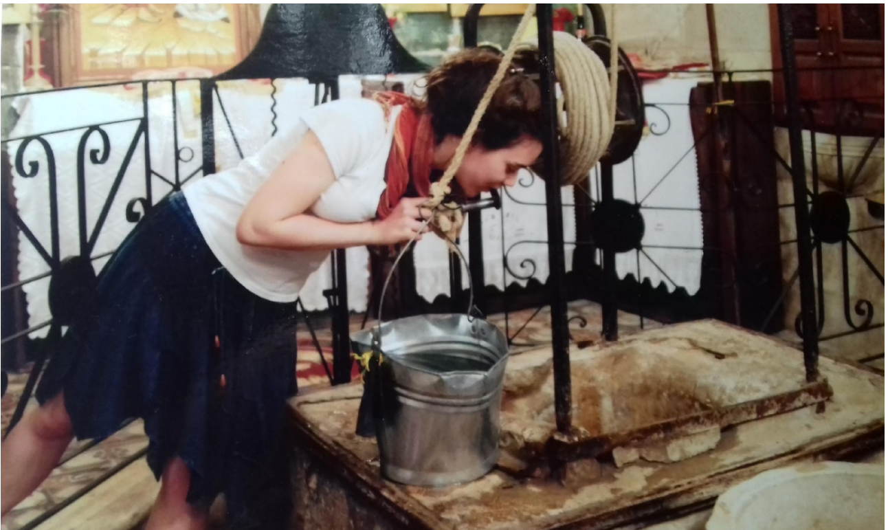
Puits de Jacob - Monastère Grec Orthodoxe de Naplouse

Baptisé pour être prophète avec le Christ