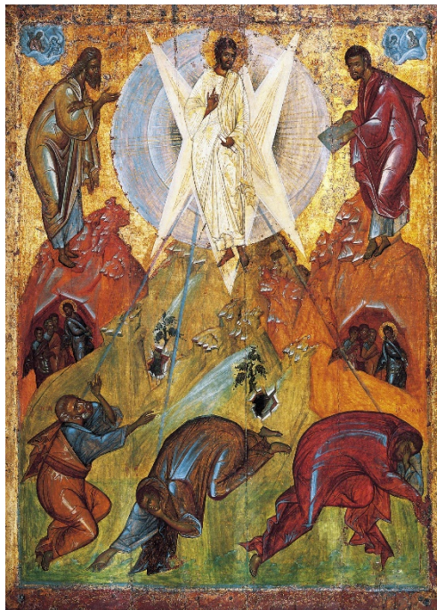
Icône de Théophane le Grec (début du XVe siècle)

Dans cette rencontre, l'évangile du 2 ème dimanche de Carême, le récit de la Transfiguration du Christ nous invite, dans notre vie de baptisé, de temps en temps, à aller sur la montagne avec le Christ, pour prier afin d'être transfigurés avant de redescendre pour témoigner dans le monde.