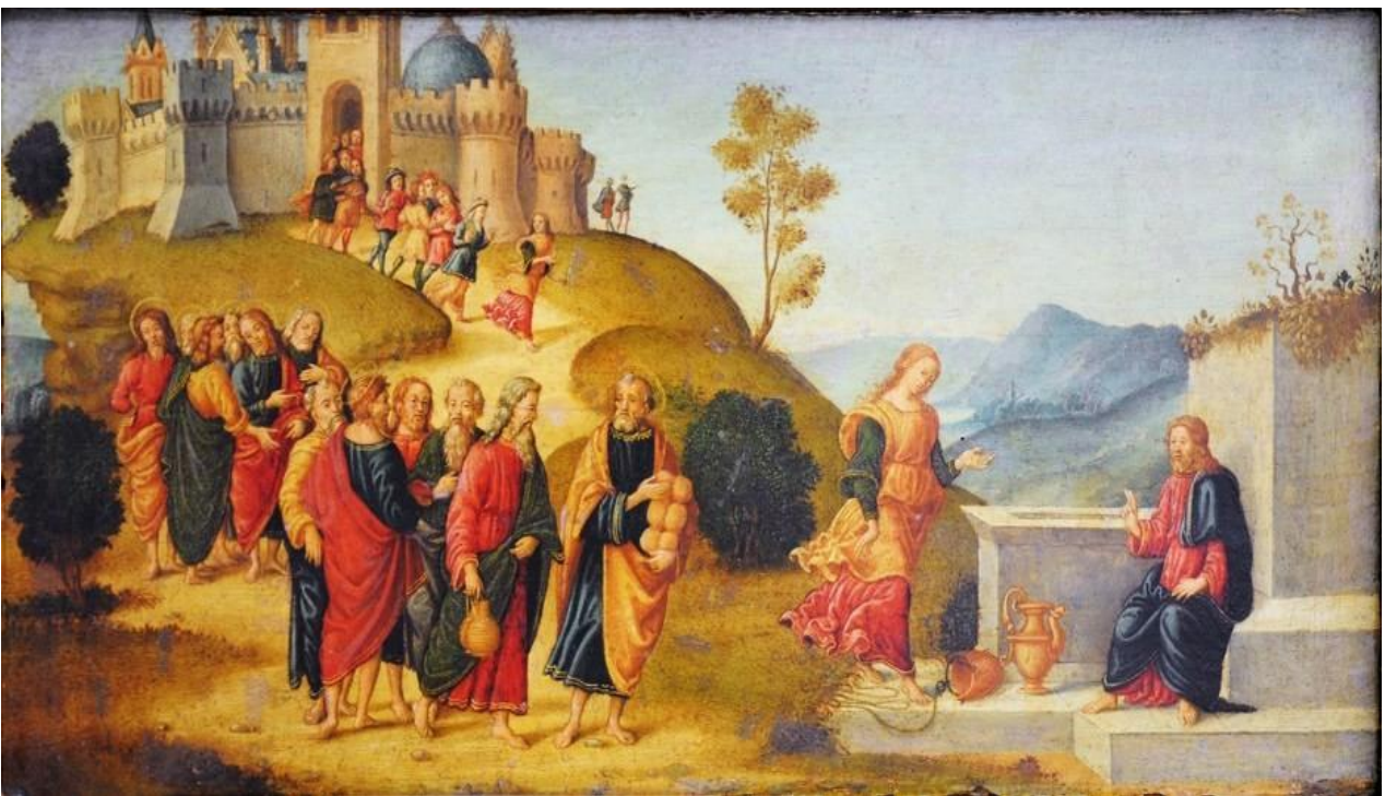
Francesco Botticini (1446-1498)

Dans cette rencontre, nous sommes invités comme la samaritaine à rencontrer le Christ. Il se révèle à nous. Baptisés, nous sommes transformés par Jésus, par le don de Dieu, nous recevons son eau jaillissante pour la vie éternelle. Ce don, nous ne pouvons le garder pour nous. Nous témoignerons de lui comme la samaritaine.